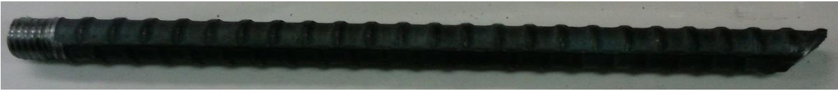
先端45度カット（ケミカル用）